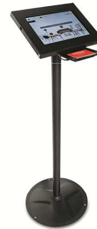
TABLETTES TACTILES D'AMBIANCE DEVANT CHAQUE ÎLOTS D'INSPIRATION : CLIENT RECONNU, INFORMATIONS PRODUITS EN DIRECT