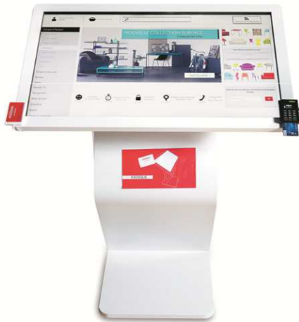
KIOSQUES TACTILES : LE CATALOGUE MILIBOO EN QUELQUES CLICS, IDENTIFICATION CLIENT, FINALISATION PARCOURS D'ACHAT