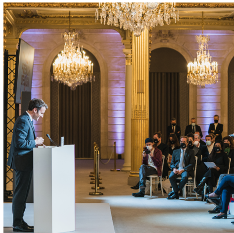
Monsieur Emmanuel MACRON Président de la République française Discours prononcé à l'occasion de la cérémonie de remise du prix

« La remise du prix Le FRENCH DESIGN 100 , c'est le rendez-vous annuel de toute une corporation : un véritable rituel, un moment-clé propulsé par le design français. Il ne célèbre pas uniquement les 100 meilleurs projets de design et d'architecture d'intérieur français dans le monde, mais rend également hommage à tout cet écosystème que nourrissent des designers, des fabricants, des savoir-faire uniques... autant de composantes essentielles à notre art de vivre à la française. »